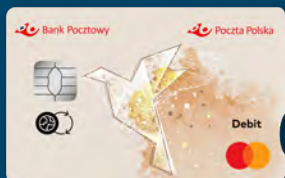
Karta z logo Poczty Polskiej

Karta wydawana w postaci fizycznej, zapewniająca wygodny dostęp do pieniędzy zgromadzonych na Twoim koncie z każdego miejsca na całym świecie.