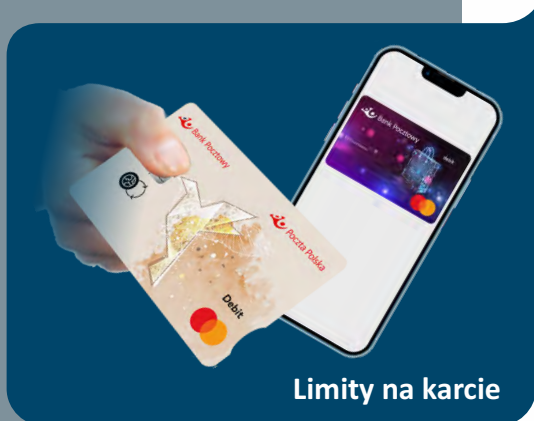
Limity na karcie